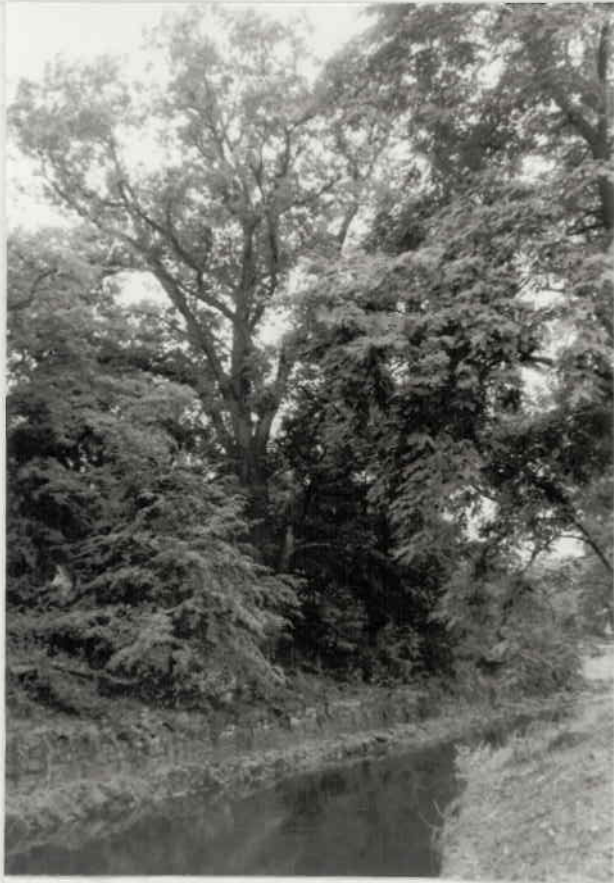
VON N.O. (MÜHLENTFAHRT)

TRAUBENEICHE AUF PARZ. 2107/9. HORN - NATURPARK