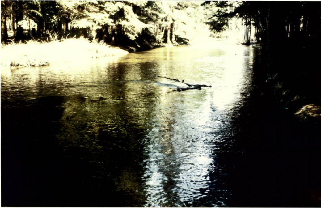
PURZELKAMP Rappoltschlag - Kamles nahe d. Ringmühle (fluß. aufwärts)