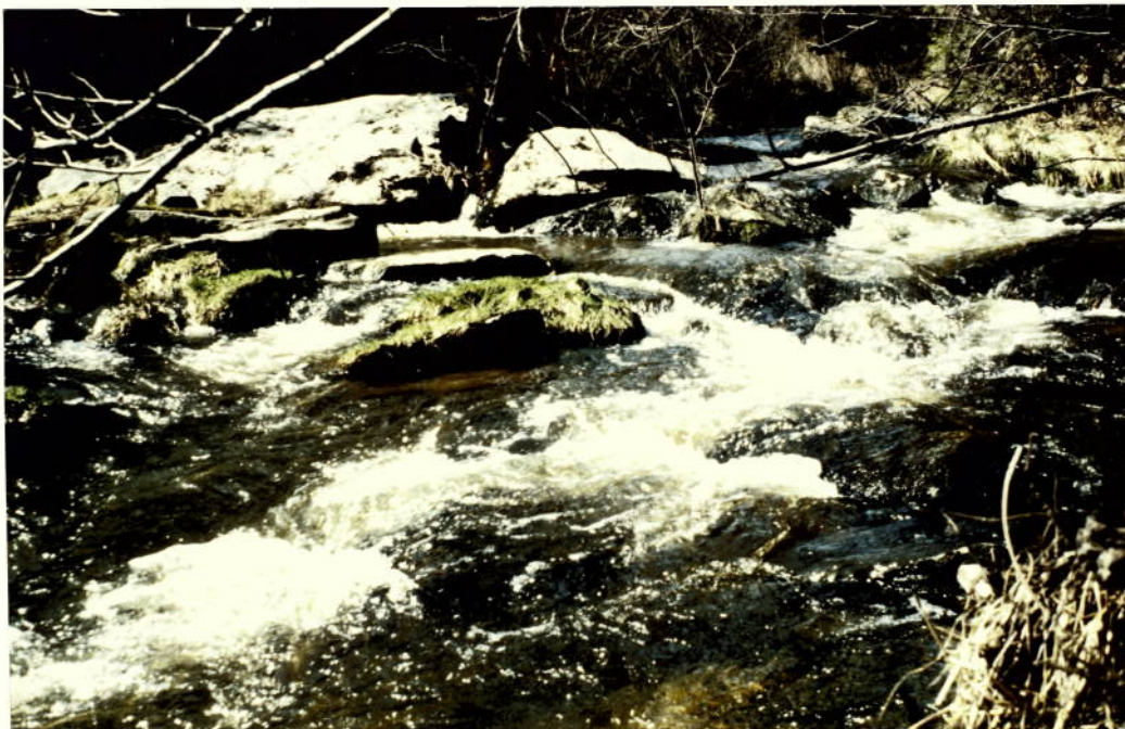
PURZELKAMP FLUSSAUF KNAPP UNTER D. RINGMÜHLWEHR