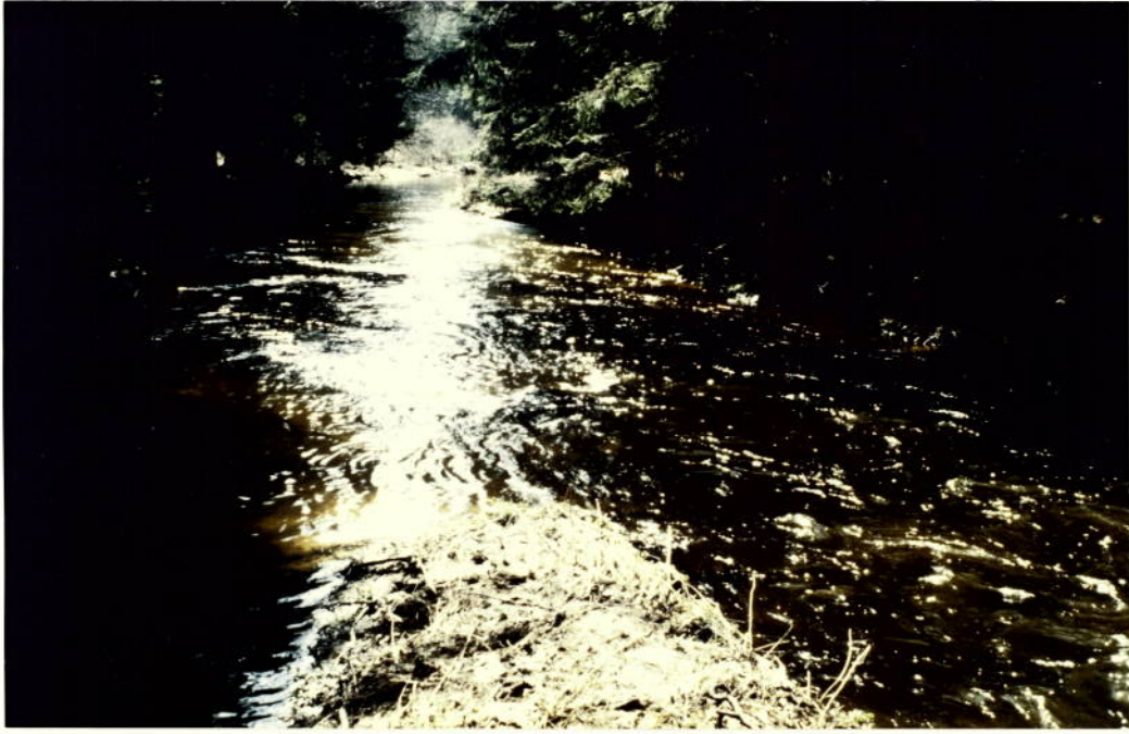
Purzelkamp Kamles-Rappoltschlag, Beginn d. Rückstaus d. Ringmühlwehr (flußab, v.d. Halbinsel bei d. verfallenen Mühle)