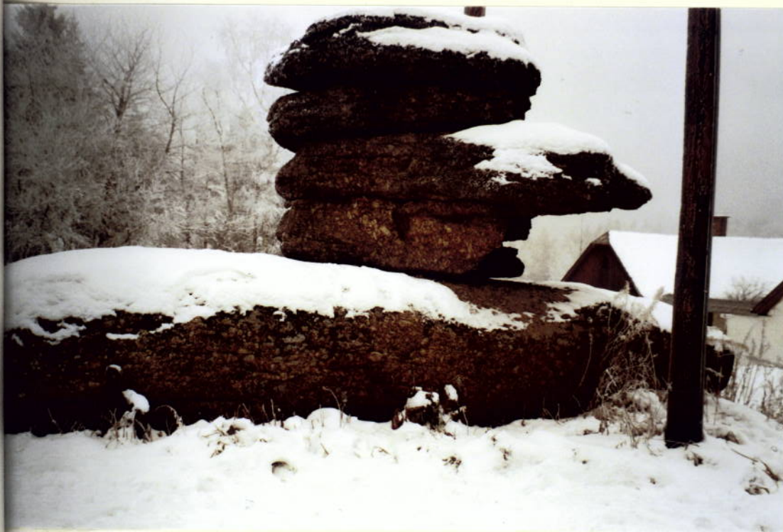
Bild 1 - Straßenseitige Front des Felsgebildes, Tisch und Auflagegesteine gut erkennbar.