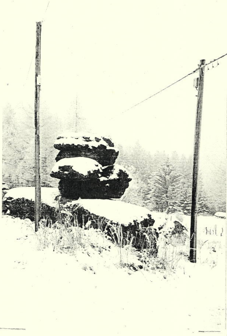
Bild 2 - Blick von der Straße aus zeigt die optisch negative Wirkung der beiden im Gutechten angesprochenen Masten.