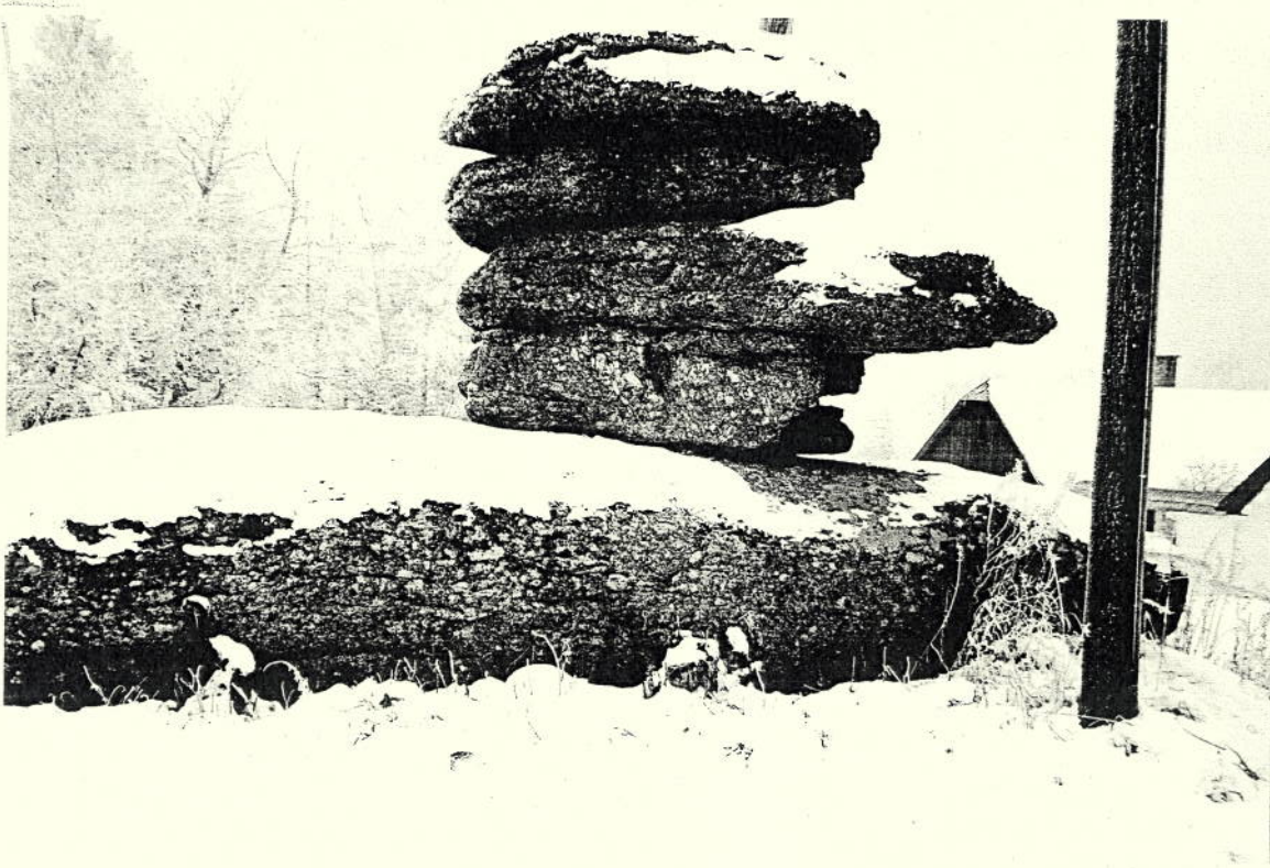
Bild 1 - Straßenseitige Front des Felsgebildes, Tisch und Auflagesteine gut erkennbar.