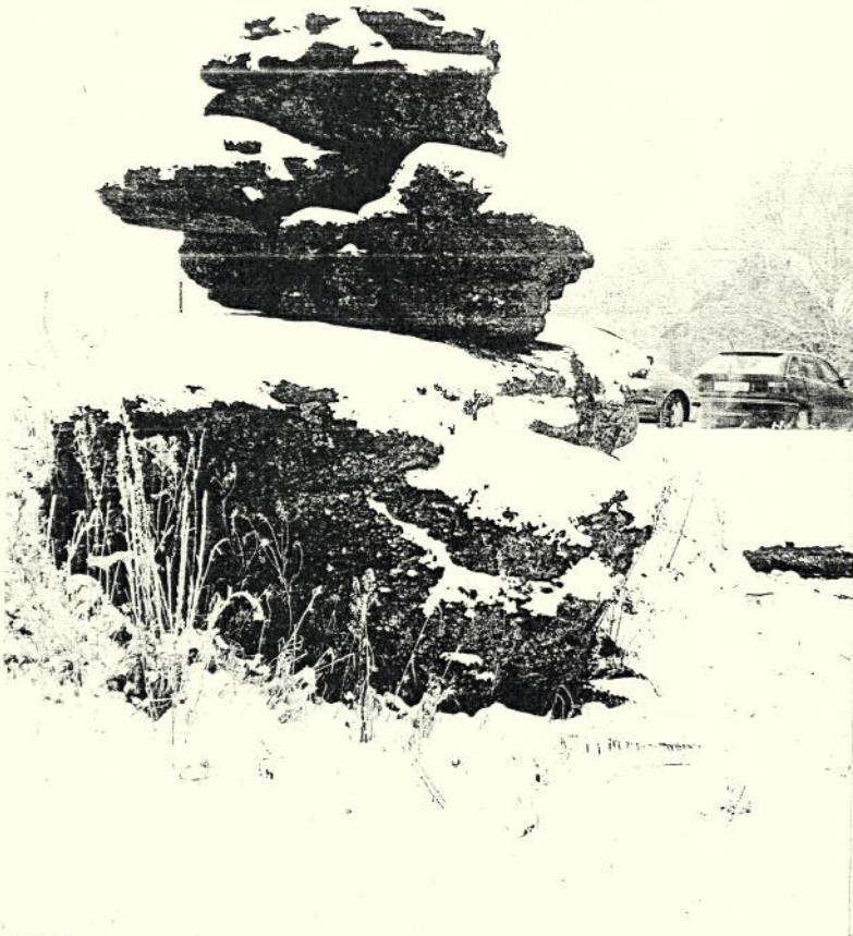
Bild 2 - Blick auf den unteren Teil des Felsens - Risse und Klüfte bei den Auflagesteinen deutlich sichtbar.