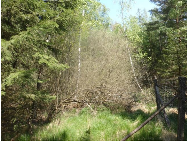
Bild 4: Weggrundstück innerhalb des Naturdenkmales, Blick Richtung Nord-Ost