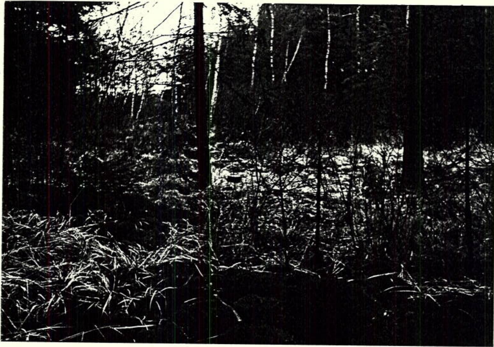
NORDRAND DES PARZ 1237 (NAHE STANDORT FOTO 6) BUCK GEGEN OSO (WEG, WALDRAND)