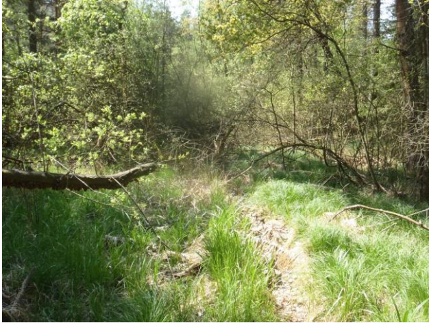
Bild 1: Weggrundstück innerhalb des Naturdenkmales, Blick Richtung Süd-West