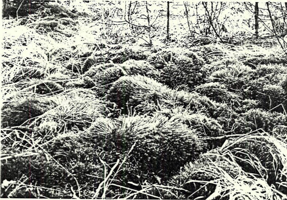
STANDORT WIE VOR