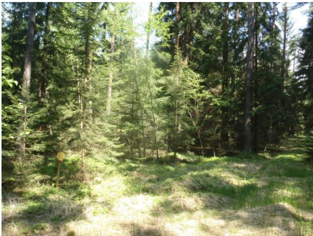
Bild 3: Weggrundstück außerhalb des Naturdenkmales, Blick Richtung Nord-Ost