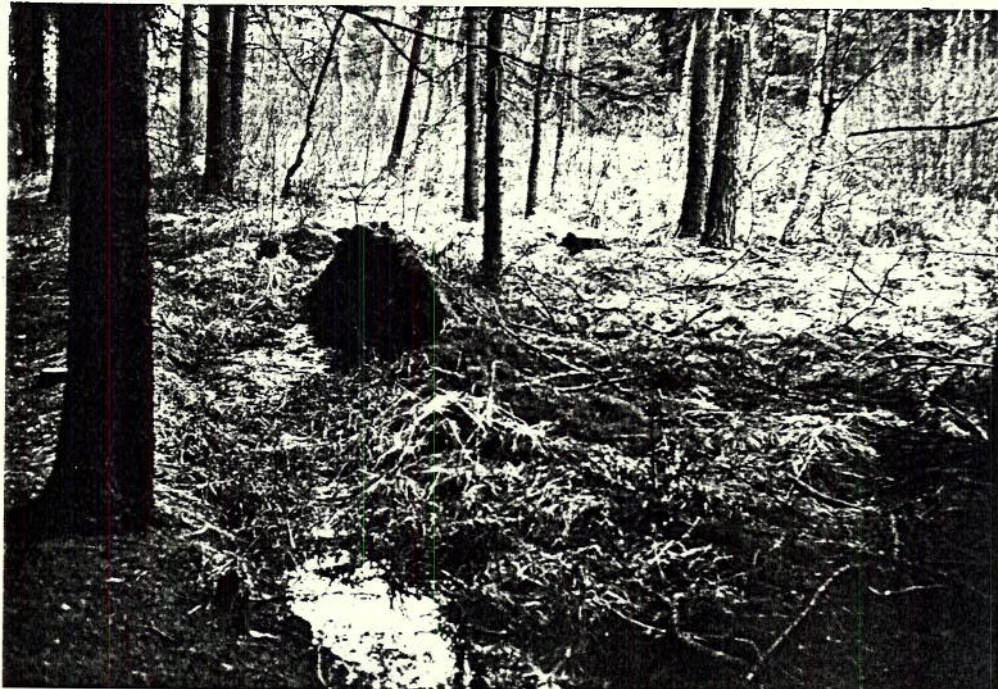
NORDRAND DES PARZ 1237 (GEGEN WALD LINKS) MIT BUCKRICHTUNG OSTEN