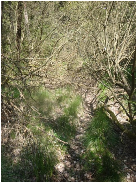
Bild 5: Weggrundstück innerhalb des Naturdenkmales, Blick Richtung Nord-Ost