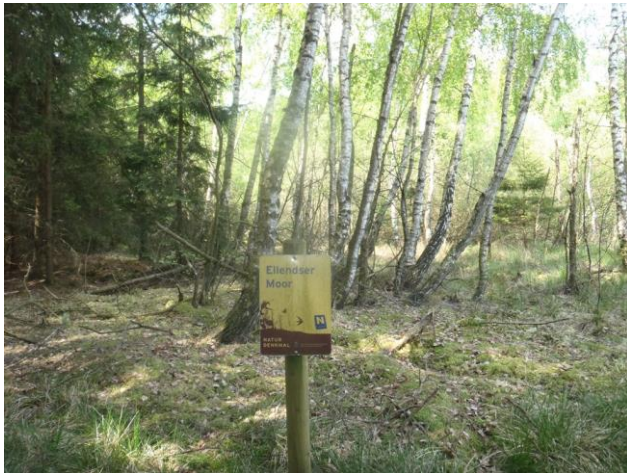
Bild 7: Blick vom östlichen Rand in das Naturdenkmal Richtung Westen